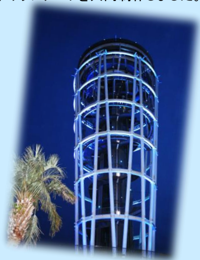
4月2日世界自閉症啓発デー 江の島シーキャンドル