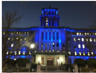
神奈川県庁本庁舎

今年は相模原市の「ウェルネス相模原」の建物が、新たにブルーライトアップされました。