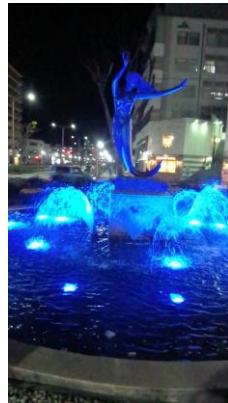
平塚駅南口広場 噴水「海の賛歌」