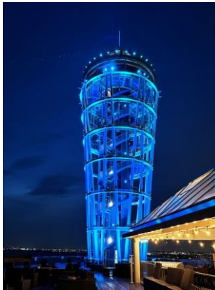
江の島シーキャンドル